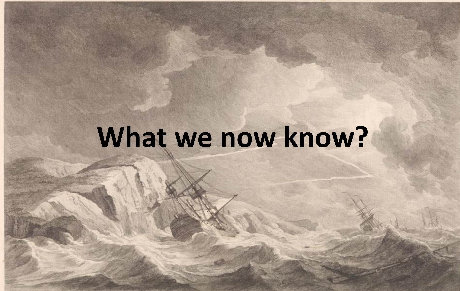
The Wreck of the Nuestra Señora de los Remedios (alias La Ninfa) a prize to the Royal family. Privateers taken 5 February 1746 and left in November following, near Beachey head on the coast of Sussex. Published according to Act of Parliament, 1752, & sold by J. Bingley, Carpenter, at the Anniversary of the Trustees of the British Museum, 21, New Street, London.