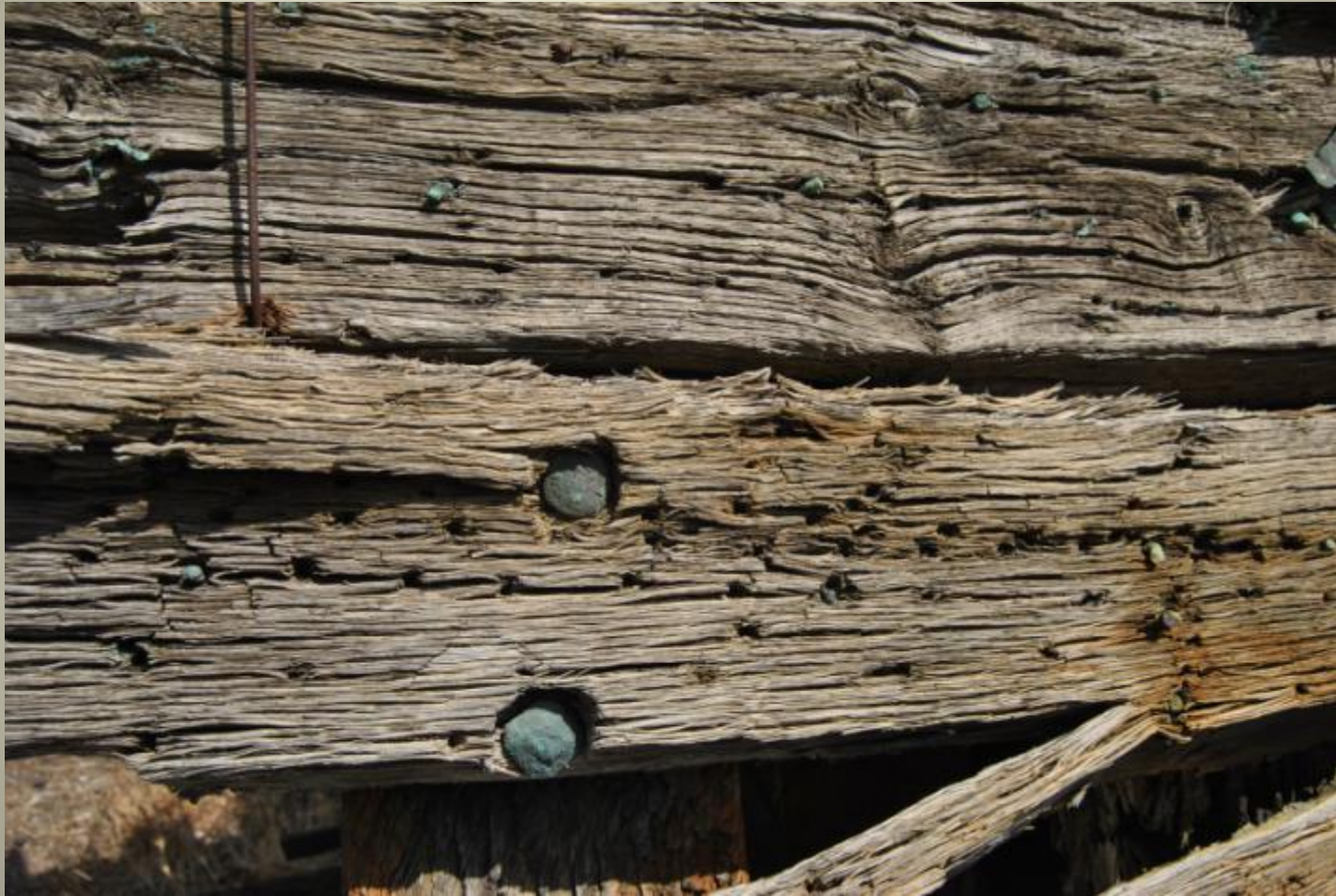
Timber in La Carraca, Cádiz.